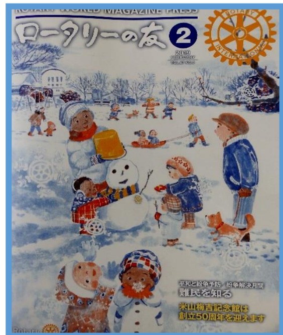
米山梅吉誕生 150 年記念 (P16)