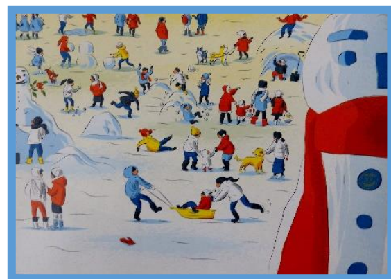
クラブを訪ねて・秩父RC (P9)