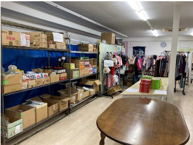
思いやりスーパー