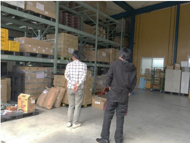
埼玉県八潮市倉庫のセカンドハーベストジャパン (フードバンク)