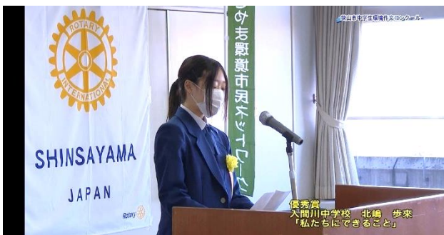
優秀賞 「私たちにできること」 「環境問題」 「STOP! 地球温暖化」 「児童婚の加速と環境」