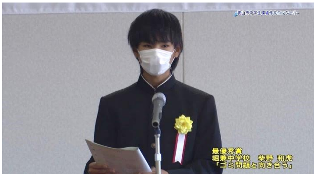
最優秀賞 「ごみ問題と向き合う」 自分以外の意見も含め、自分ができることから環境問題に取り組んでいこうと思います！