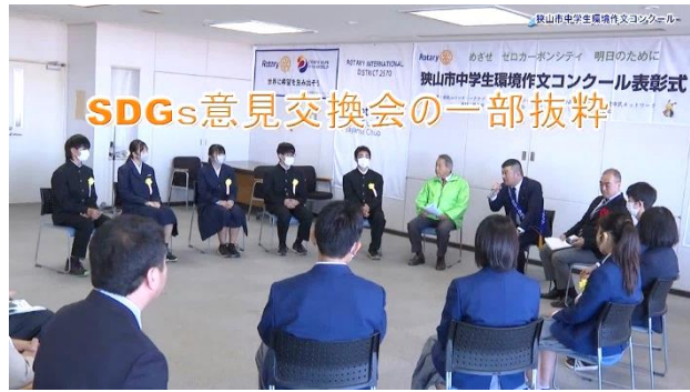
今回から新しい企画として、表彰式終了後、狭山市長を交えた意見交換会を行いました。