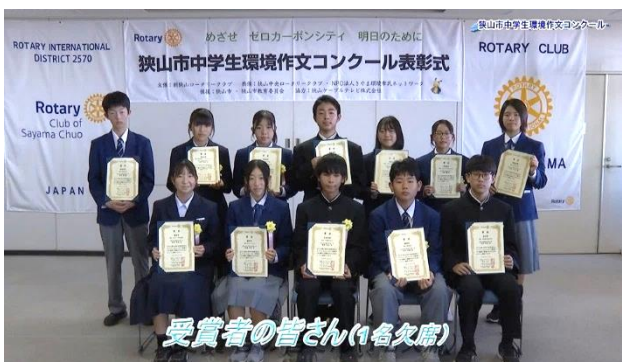
受賞者の皆さん(1名欠席)