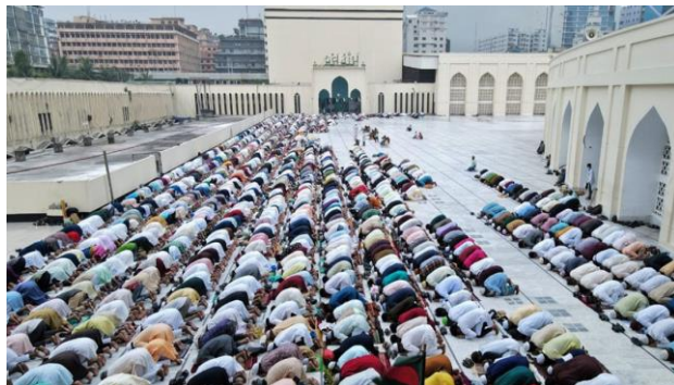
お父さんが生まれたバリサルあたりの写真

バングラデッシュの主な宗教はイスラム教で、1日5回アッラーにお祈りをします。また、年2回イスラム教の大きなお祭、イードがあります。