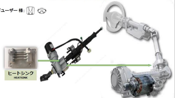
鋳造、加工、検査の工程を通して製品を製造している。