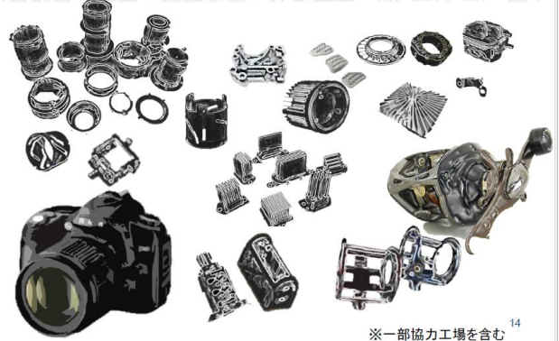
※一部協力工場を含む 14