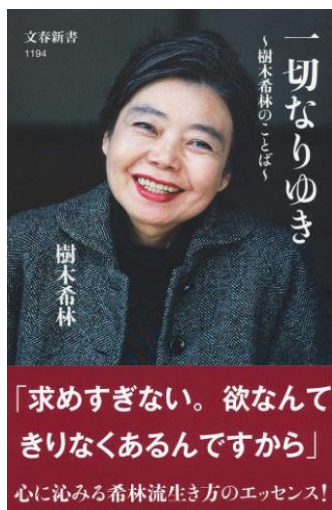
樹木希林著「一切なりゆき～樹木希林の言葉～」 文春新書 1194

樹木さんは無駄を嫌う人で、生前ご自身の本は1冊も出版していませんでした。しかし、物事をバツサリ切り取る発言や名言が多いということで、没後何冊の本も出版されています。この【 一切なりゆき 】という本は2019年の年間ベストセラー1位になっています。