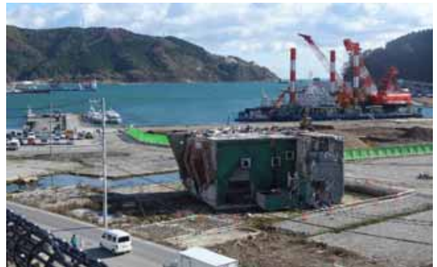
このまま遣される(予定)被災した建物