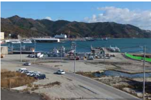
海岸べり瓦礫がほぼ撤去されている