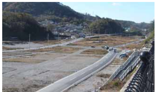
整備されつつある道路