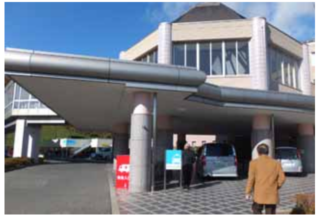
整備された女川町病院