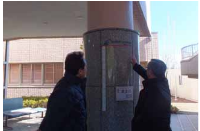
津波が到達した高さを示す柱